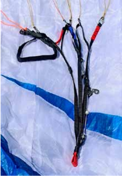
Suspentage non gainé et élévateurs assez courts, comportant pour le pilotage une sangle d'appui entre les branches C et B.