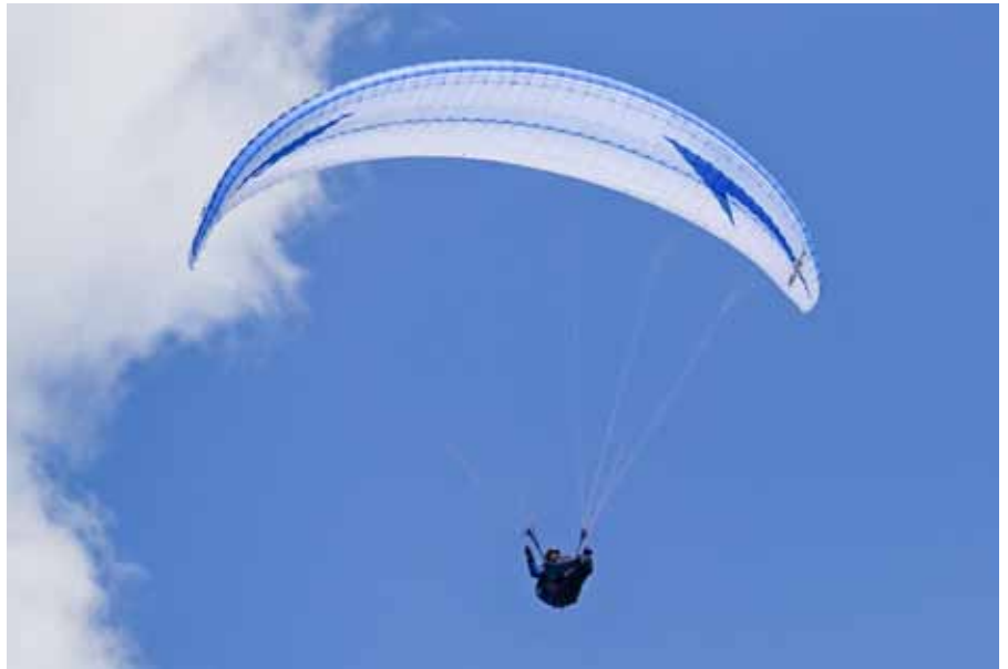
L'allongement de 6,1 est devenu réduit pour la catégorie EN C, où les valeurs ont tendance à bien grimper... L'Helios RS dégage pourtant une allure racée.

Bon, soyons clairs, si tout pilote peut bien sûr subir des incidents de vol majeurs, il faudra vraiment chercher les problèmes avant d'obtenir des fermetures massives sous l'Helios RS... Même en turbulences bien fournies et au milieu de thermiques délicats, je n'aurai obtenu que de faibles fermetures en bout d'aile. Ça, c'est pour la solidité. Mais les comportements hors domaine de vol sont aussi très importants... Et du coup, pour ce que j'ai provoqué, l'Helios RS offre des réactions très mesurées pour la catégorie et l'allongement.