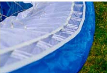
Le bord d'attaque de belle facture, comme tout le reste. De fins joncs en Nitinol, légers, assurent la mise en forme du profil.