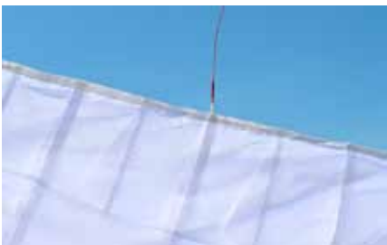
Les mini-ribs sont à coutures internes pour éviter leur abrasion. Notons la présence de solides gallons, en bords d'attaque et de fuite.