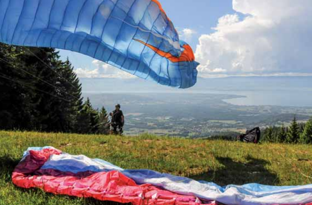
Au décollage de Très-le-Mont, à Orcier. Les bords du Léman sont souvent épargnés des orages qui se développent dans le Chablais ou sur le Jura, en face. À surveiller tout de même...

régime de Nord-Est soutenu qui place le décollage en thermiques sous le vent. Logiquement dans ces conditions, les sorties peuvent être turbulentes.