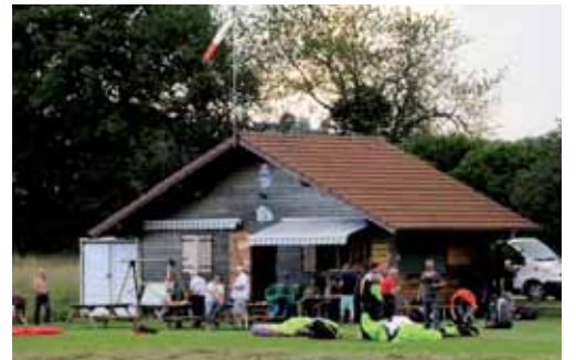
Le chalet du CHOTO, à l'atterrissage des Grands Champs. Bar, point de rendez-vous, plan des sites que vous trouverez aussi aux décos, et vous remarquerez comme ils sont bien faits.