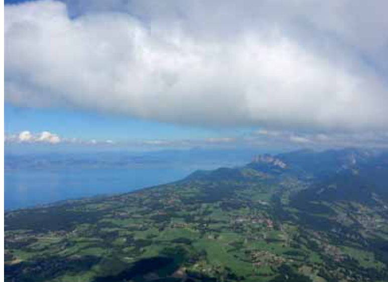
Haut sur les pistes de Thollon-les-Mémises. Sur l'autre rive du lac, c'est Lausanne.